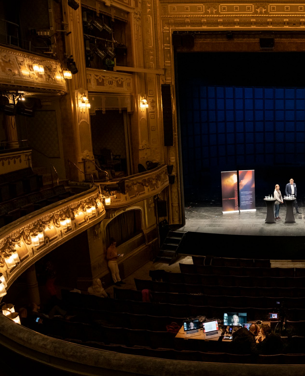
Svensk Scenkonsts digitala branschdag 2020, som sändes från Dramaten.