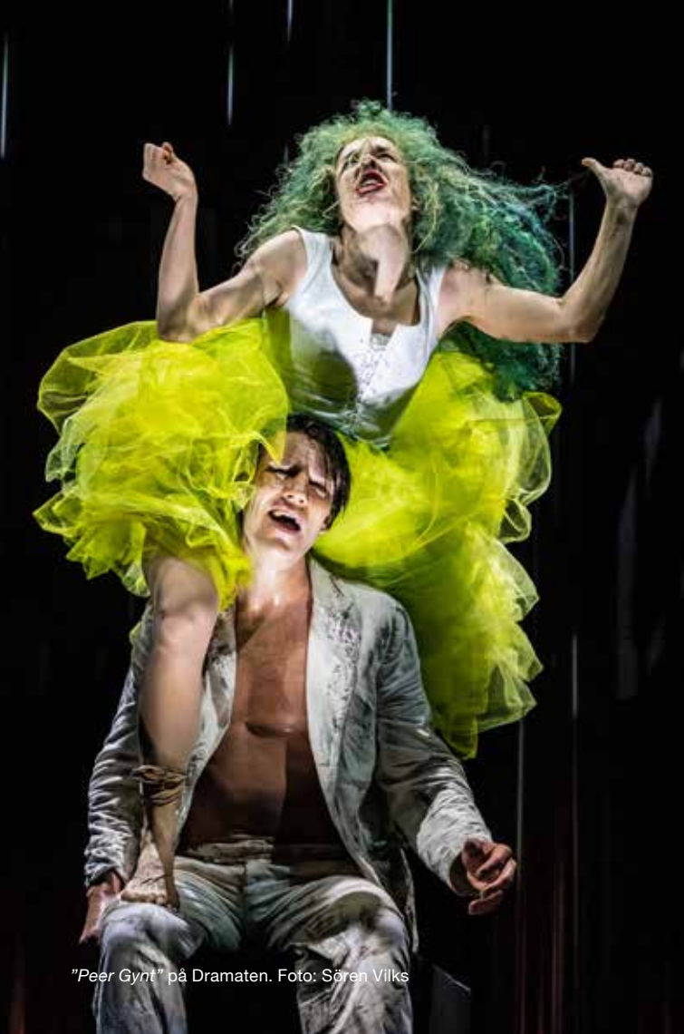
"Peer Gynt" på Dramaten.