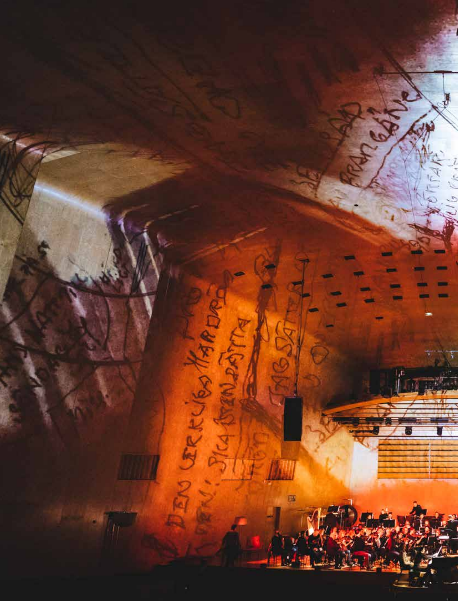
"Ingemar Bergman, 100 år" på Göteborgssymfonikerna.