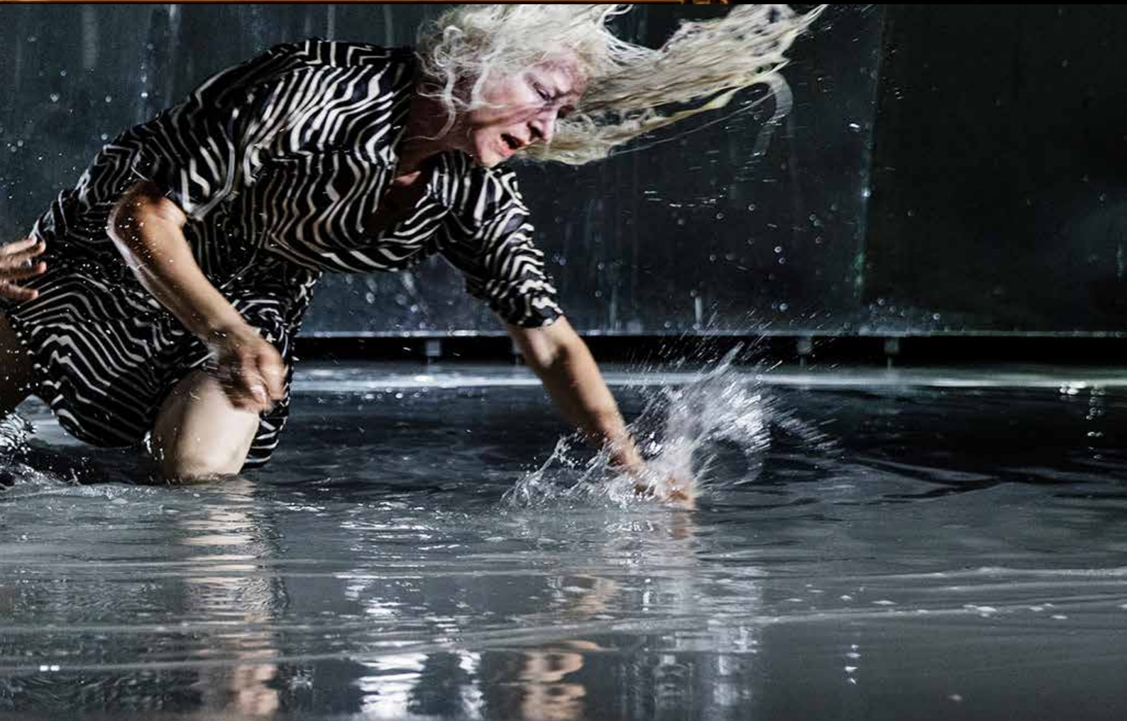
"Persona" på Malmö Stadsteater.