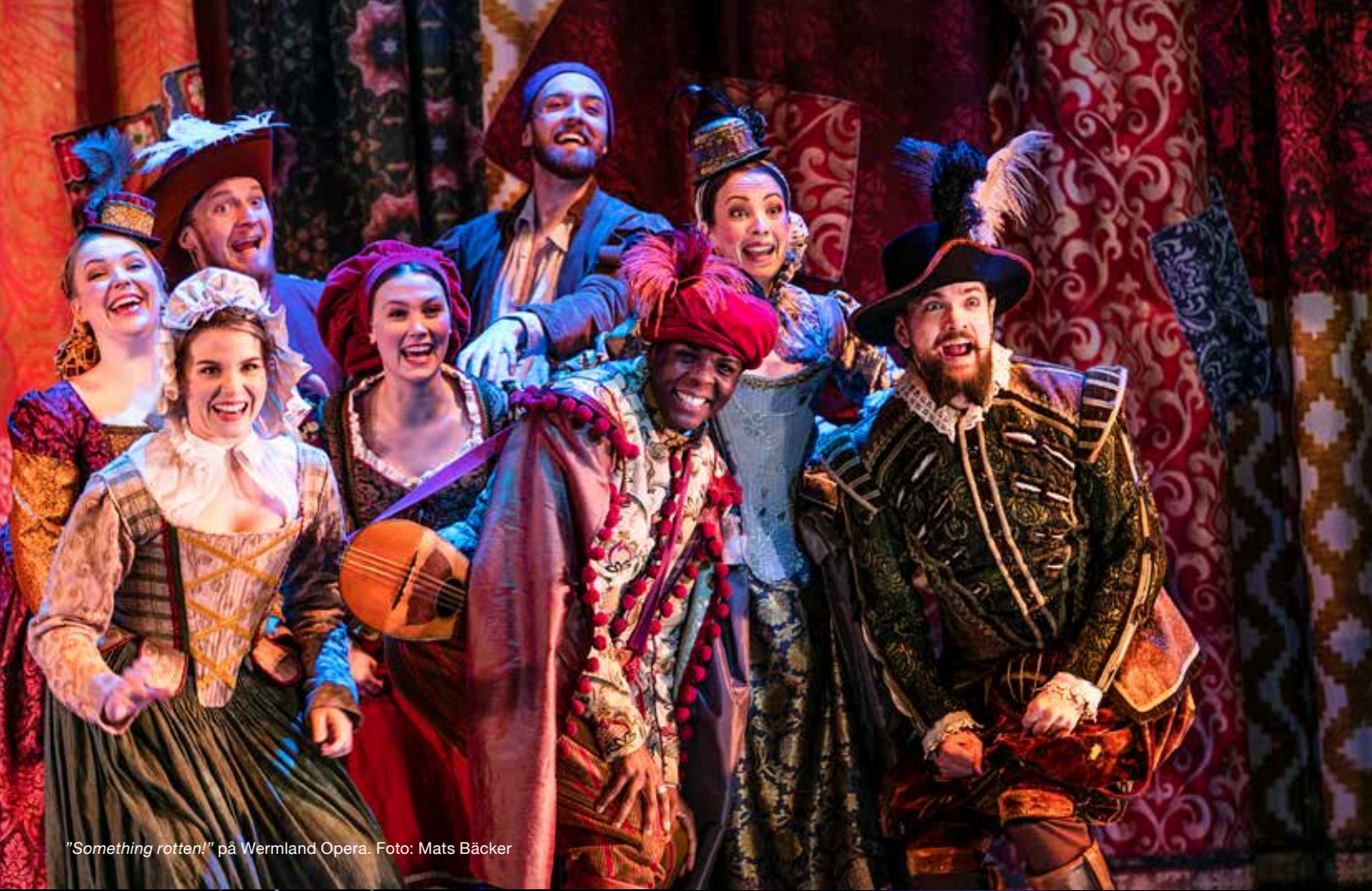
"Something rotten!" på Wermland Opera.