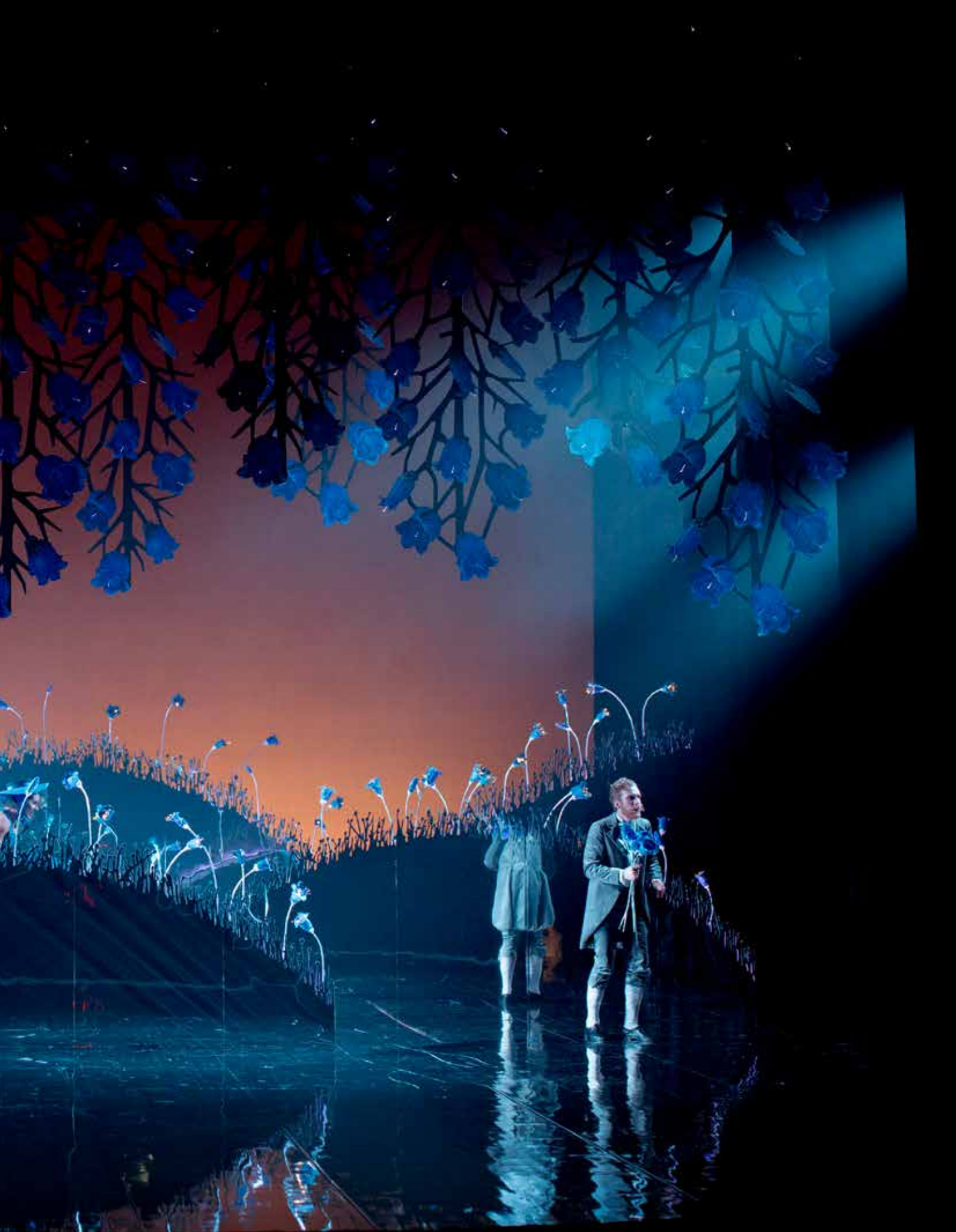
"Rapunzel" på Helsingborgs stadsteater.