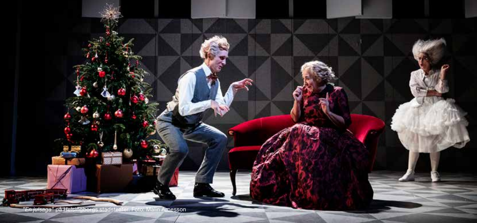
"En julsaga" på Helsingborgs stadsteater.

gats av medlemmarna och andra områden som bedöms behöver uppmärksammas särskilt. Totalt erbjöds över 30 utbildningsdagar under 2018.