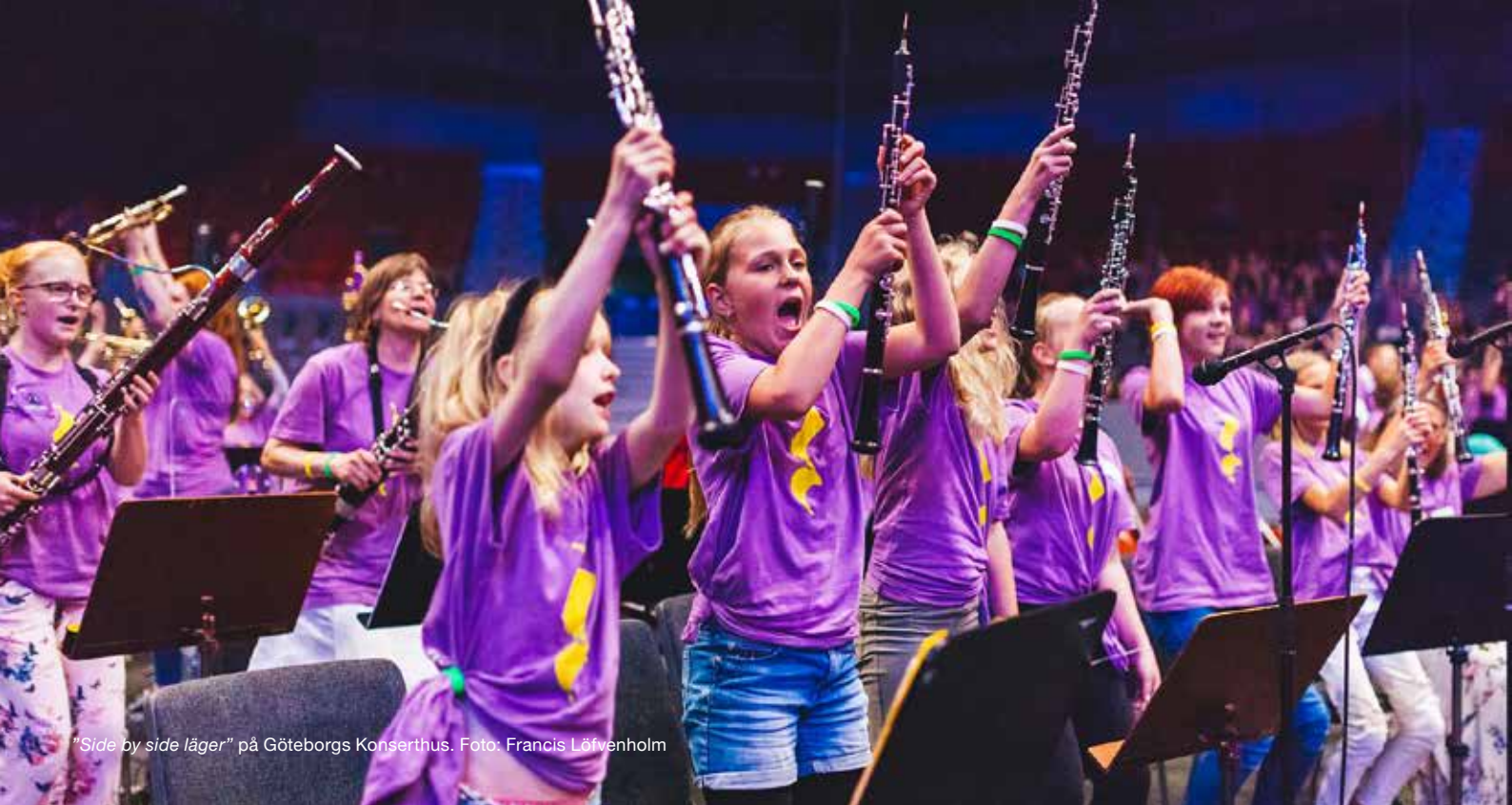
"Side by side läger" på Göteborgs Konserthus.

drygt 200 mnkr. Förändringen avser främst minskade anslag till Kulturskolan (100 mnkr) och till de statliga museerna avseende fri entré (60 mnkr).