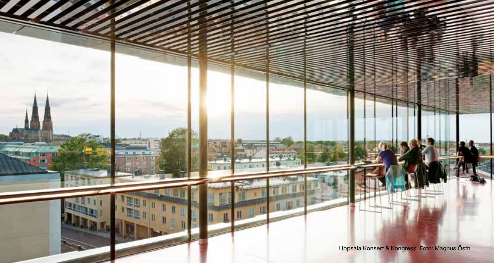
Uppsala Konsert & Kongress.

enbart konstnärspolitiken. Ett utvidgat perspektiv på hela området efterfrågades därför i remissvaret.