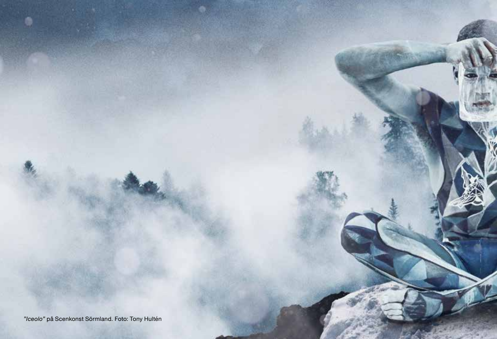
"Iceolo" på Scenkonst Sörmland.