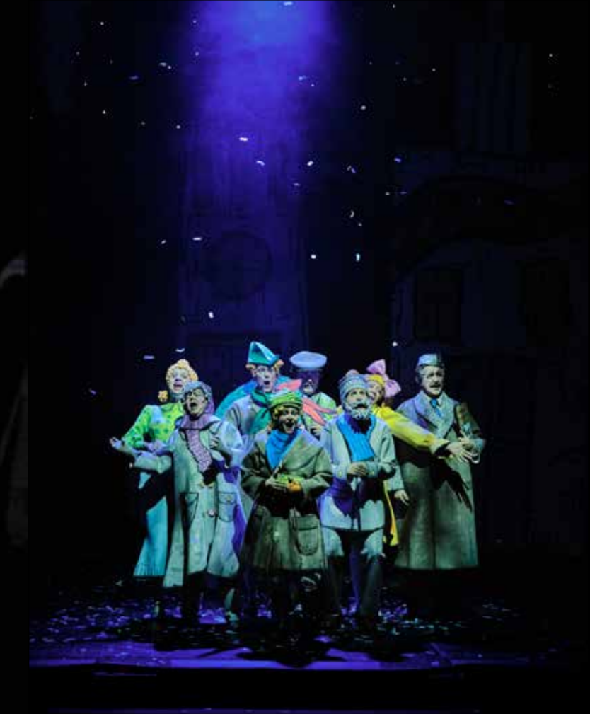
"Karl Bertil Jonssons Julafton" på Uppsala stadsteater.