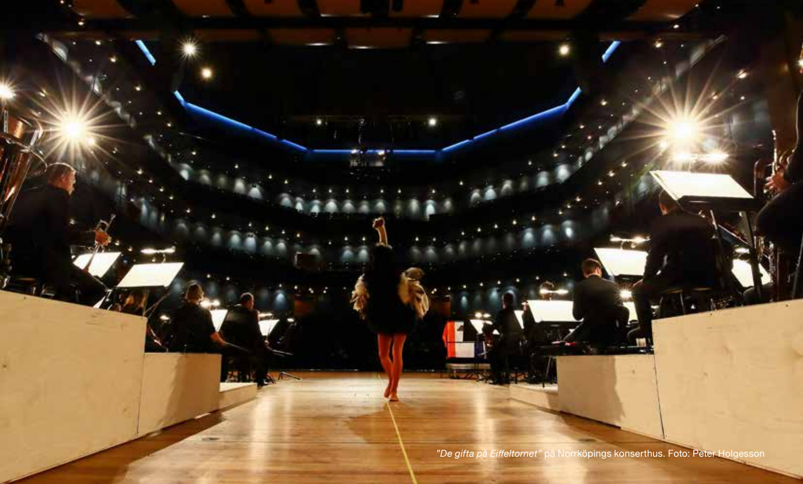
"De gifta på Eiffeltornet" på Norrköpings konserthus.

Kungliga Operan AB Kungssportshuset i Göteborg AB* Länsmusiken i Örebro AB Länsteatern i Örebro AB Länsteatrarna Sverige Service AB MA Musikalliansen i Sverige AB Malmö Live Konserthus AB Malmö Opera och Musikteater AB Malmö Stadsteater AB Musik i Syd AB NorrlandsOperan AB Nya Västanå Teater Oktoberteatern, ekonomisk förening Orienteatern AB Region Blekinge (Musik i Blekinge) Region Gävleborg (Kulturutveckling) Region Halland (Kultur i Halland) Region Jämtland Härjedalen (Estrad Norr) Region Jönköpings län (Smålands Musik och Teater) Region Norrbotten (Norrbottnensmusiken) Regional Musikverksamhet Gotlands Musikstiftelse Regionteater Väst AB Riksorganisationen Folkets Hus och Parker Riksteatern Riksteatern Gävleborg Riksteatern Halland Riksteatern Jämtland/Härjedalen Riksteatern Jönköpings län Riksteatern Kalmar län