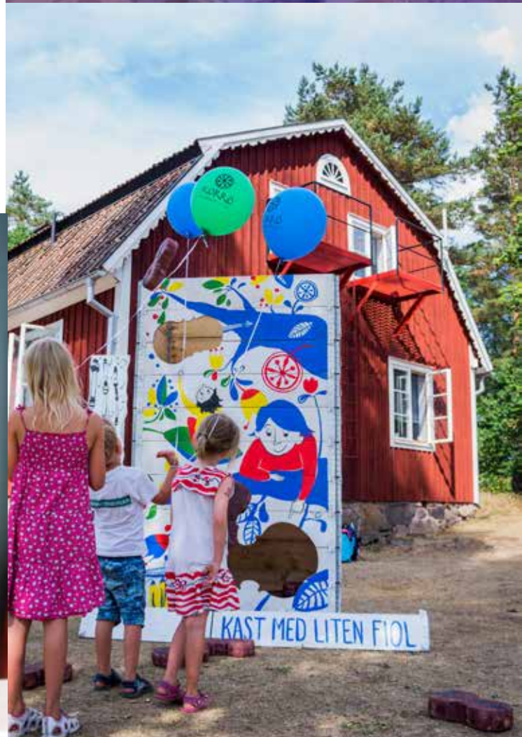
"Barnens egen Korrö" med Växjö symfoniorkester.