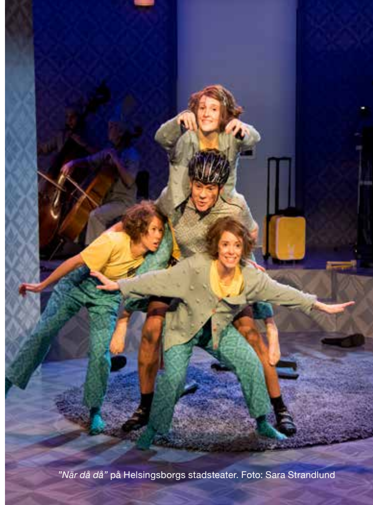
"När då då" på Helsingborgs stadsteater.