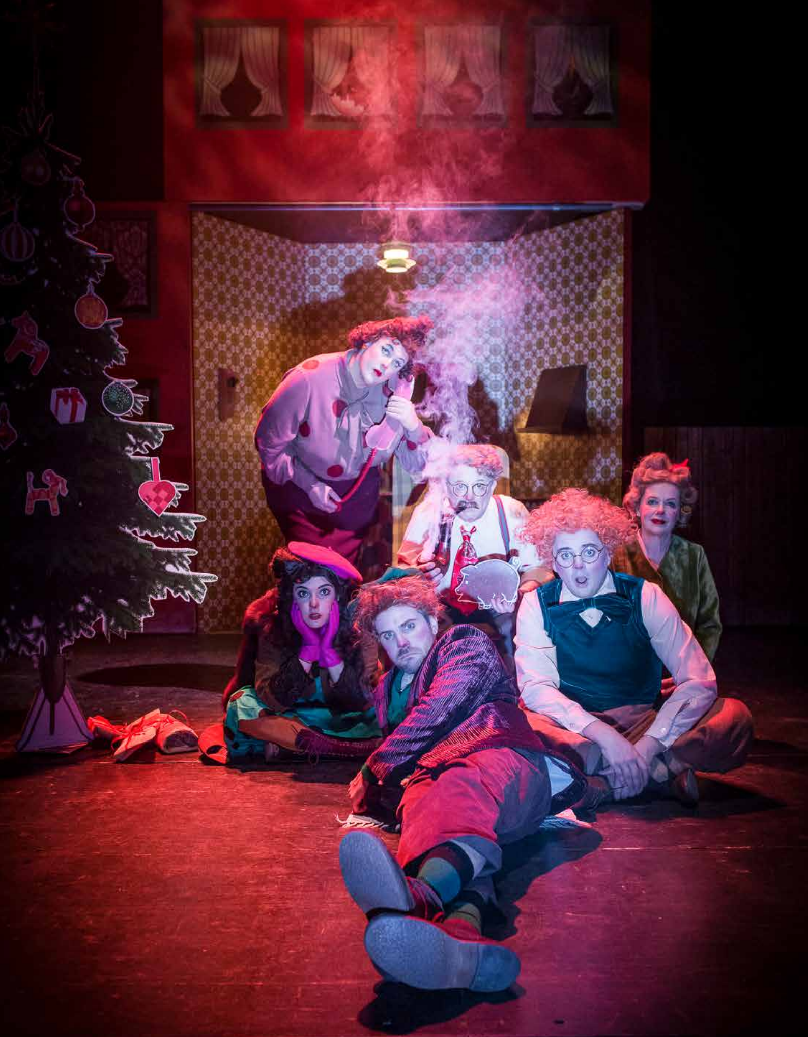
"Hassel och Tager" på Västerbottensteatern.