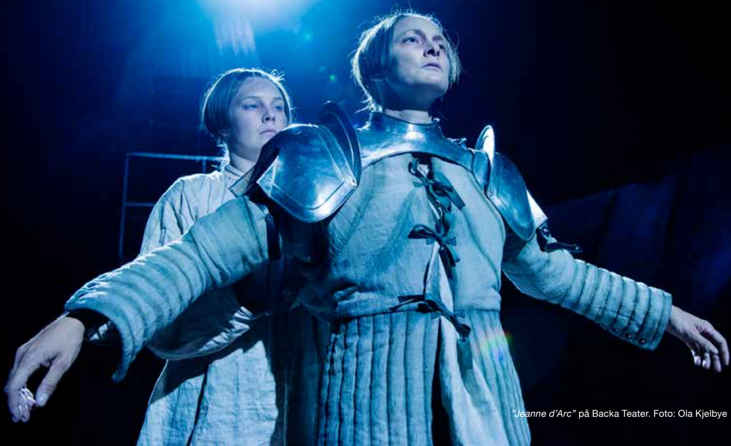
"Jeanne d'Arc" på Backa Teater.