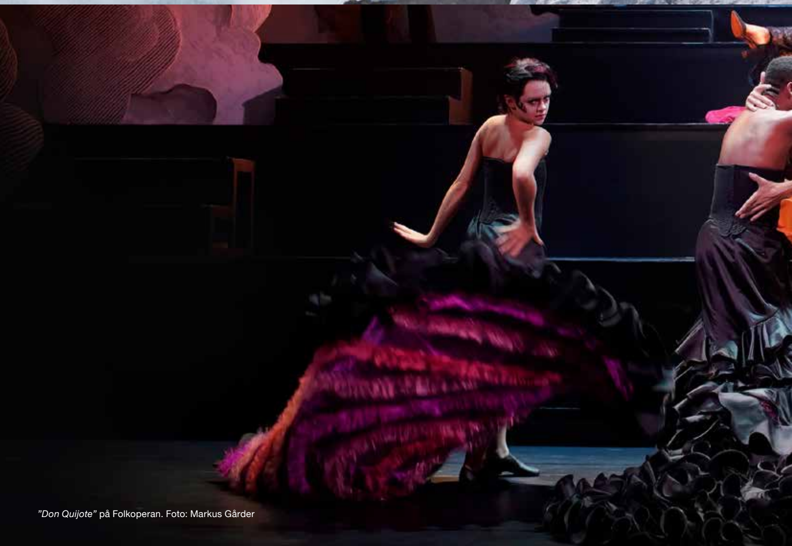
"Don Quijote" på Folkoperan.