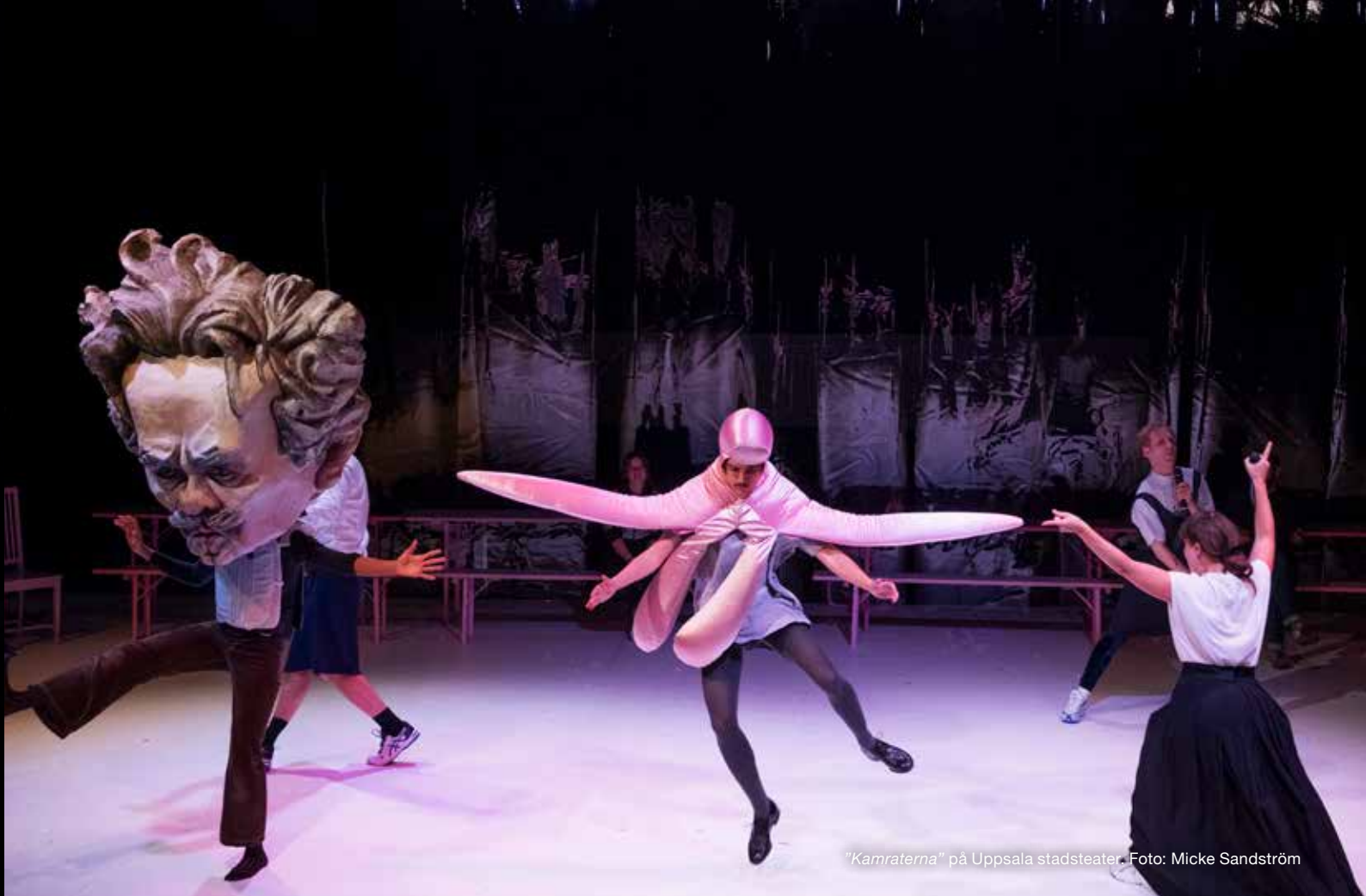
"Kamraterna" på Uppsala stadsteater.