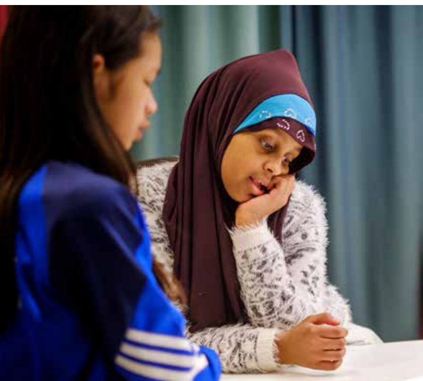
"Fyra spänn city" på Teater Västernorrland.