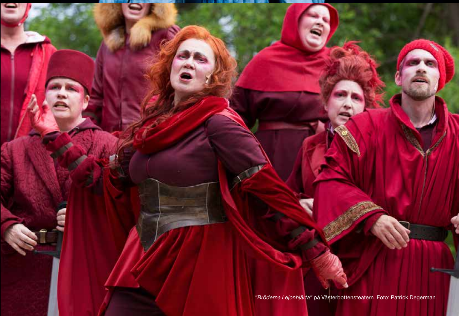
"Bröderna Lejonhjärta" på Västerbottensteatern.