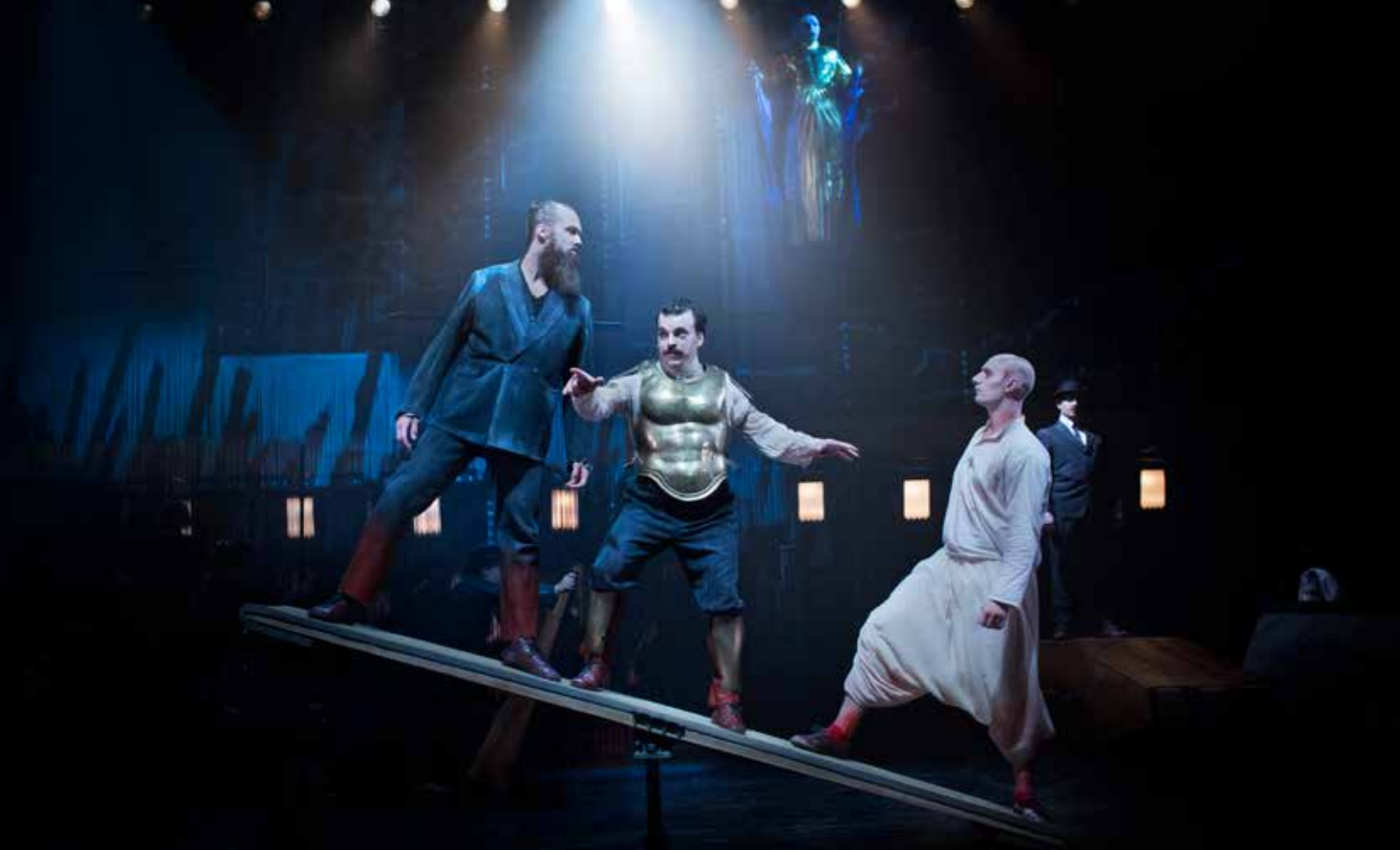
"Satyagraha" på Folkoperan.