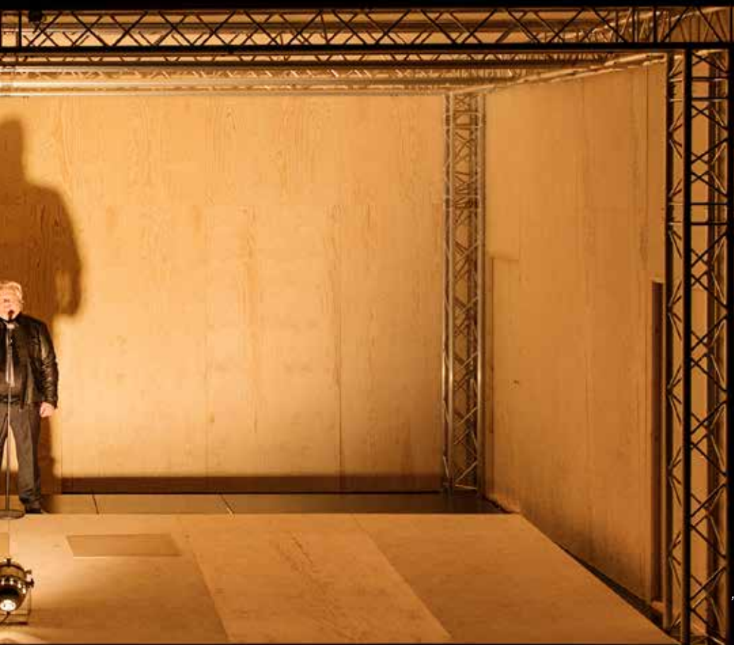
"Skuggorna av Mart" på Backa Teater.