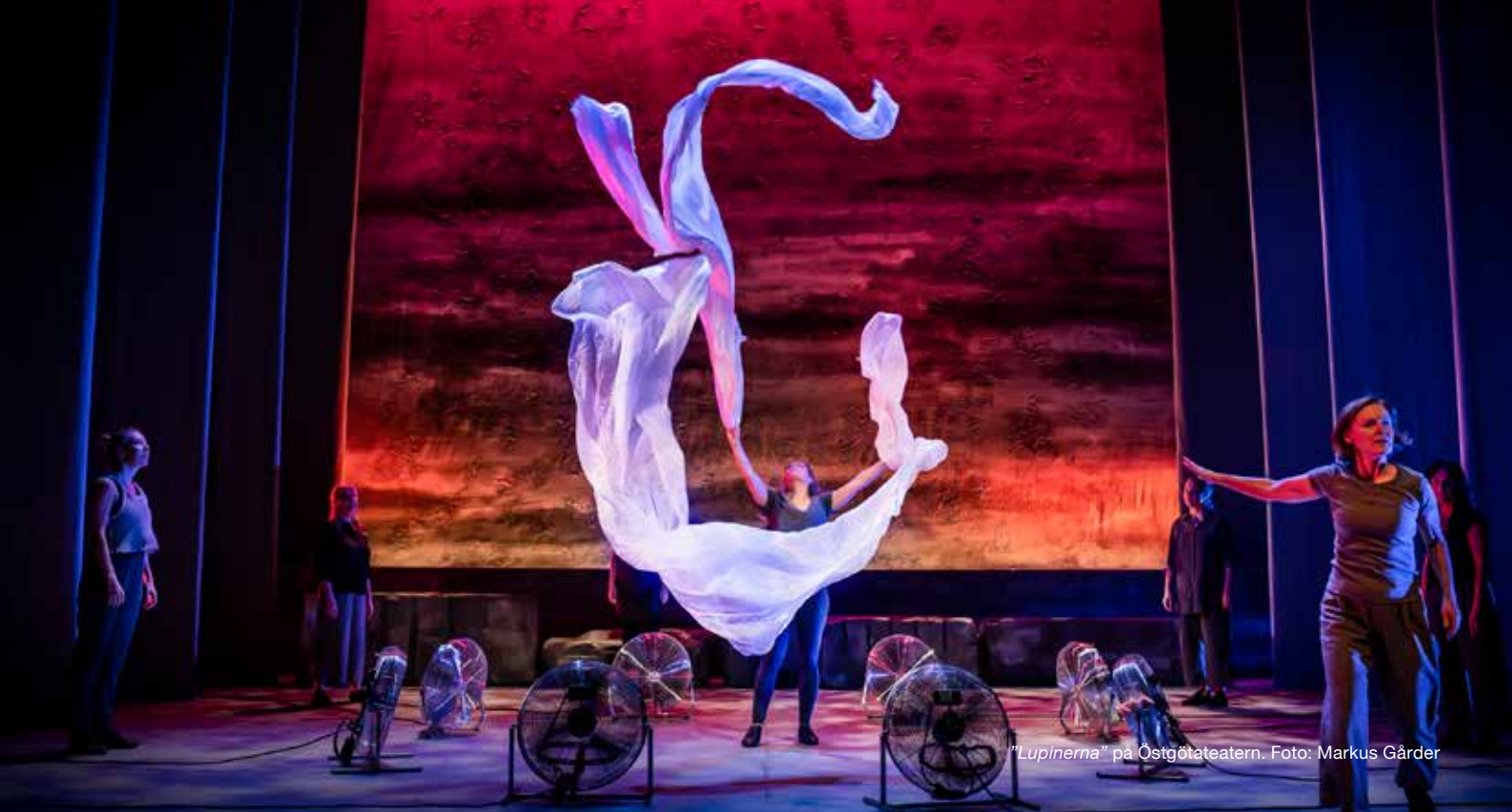
"Lupinerna" på Östgötateatern.

Behovet att klargöra partsställningen och hitta konstruktiva arbetsformer ökar inför den kommande avtalsrörelsen 2020.